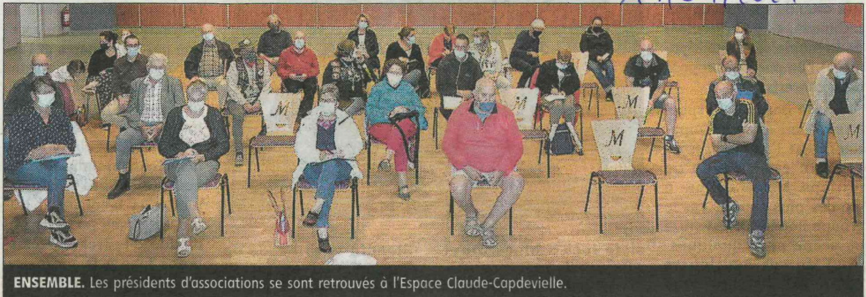
ENSEMBLE. Les présidents d'associations se sont retrouvés à l'Espace Claude-Capdevielle.

Les présidents d'associations se sont retrouvés nombreux à l'Espace Claude-Capdevielle où les avait conviés la municipalité.