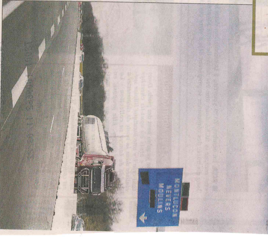
00 STROCKER Allier 1421