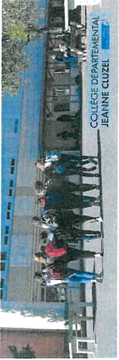
COLLEGE DEPARTEMENTAL JEANNE CLUZEL