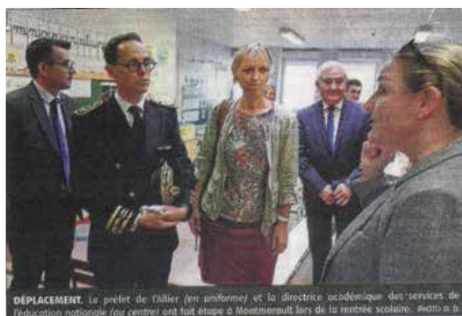
DÉPLACEMENT. Le préfet de l'Allier (en uniforme) et la directrice académique des services de l'éducation nationale (au centre) ont fait étape à Montmarault lors de la rentrée scolaire. 29/08/2019 à 16h

Le 1 er septembre, Le Préfet de l'Allier, Monsieur Christophe NOEL DU PAYRAT, a également fait sa rentrée à l'école de Montmarault, accompagné de